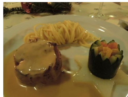
Party Schweinsfilet mit Safrannudeln und Zucchettikrone auf Kohlraben

Anschliessend genossen wir ein vorzügliches 🌟🌟🌟🌟-Menü, mit viel Liebe und Kreativität zubereitet durch unsere Küchencrew.