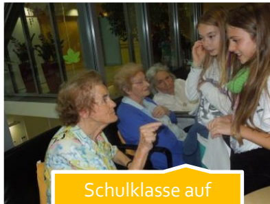
Schulklasse auf Besuch

Neueintretende Bewohnerinnen und Bewohner entrichten ausserdem ab 2014 einen Vorschuss im Betrag von Fr. 5'000.-- als Sicherheit und als Ausgleich für die rückwirkende Rechnungsstellung. Das betrifft die jetzigen Bewohnerinnen und Bewohner aber nicht.