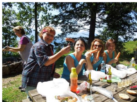
Picknick in Rigi Kaltbad

wie von selbst. Bei der wohlverdienten Mittagspause in Rigi Kaltbad, konnte endlich das reich gefüllte Lunchsäckli ausgepackt werden. Das Küchenteam hat es beim Füllen der Säckli gut gemeint. Nebst Wurst, Brot und feinen Leckereien hat auch die extra Portion Vitamine nicht gefehlt.